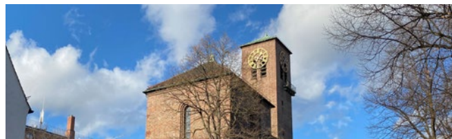
Foto: Auferstehungskirche München Titelbild: St. Maria als – Foto: Stadtlücken e.V.

Dokumentation der digitalen Dialogreihe „Öffentliche Räume in Kulturbauten der Zukunft“: www.kulturbauten.net